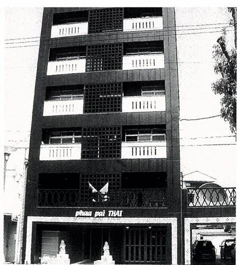
中央図書館東側に5月15日オープンする「明治ビル」。

健康ブームの影響だろうか、タイ料理やタイのマッサージに強い関心が集まっている。そのタイの魅力を満載した「明治ビル」が5月15日（木）にオープンする。場所は7月の開館目標で整備が進む中央図書館と中央公園の東側。地下1階・地上6階建て延べ1128㎡で、1・2階がタイ料理レストラン「パーパイトイ」（タイ語で「タイに連れて行く」という意味）明治町店、3階はタイ式ヨガや料理教室、4階はタイの土産を販売するコーナー、5階はタイ古式マッサージのリラクゼーションサロン「サラ」。とにかく徹底している。おまけに、3月20日には福山駅前の伏見町の「中国ビル」に「明治ビル」をPRするスーパークラフエ「パーパイトイ駅前店」までオープンした。もう一つ驚くべきことは、オーナーの平